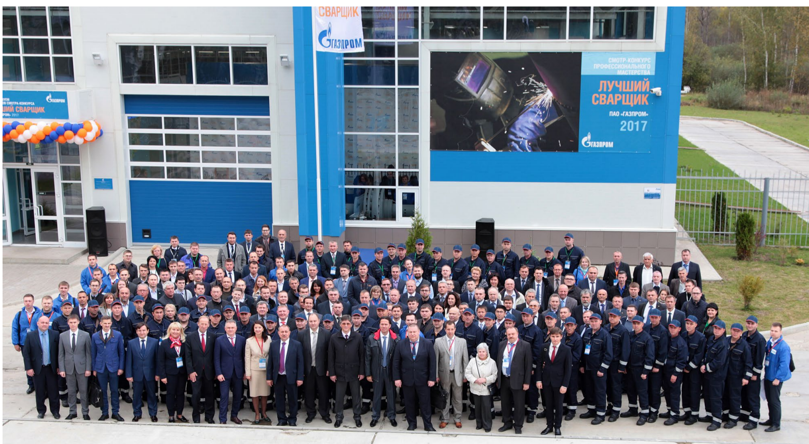
Участники конкурса «Лучший сварщик ПАО «Газпром» – 2017»

«Смотр-конкурс «Лучший сварщик ПАО «Газпром» проводится с 2003 года с периодичностью раз в два года. Среди основных целей конкурса – повышение престижа профессии сварщика и распространение передового профессионального опыта среди специалистов дочерних компаний».